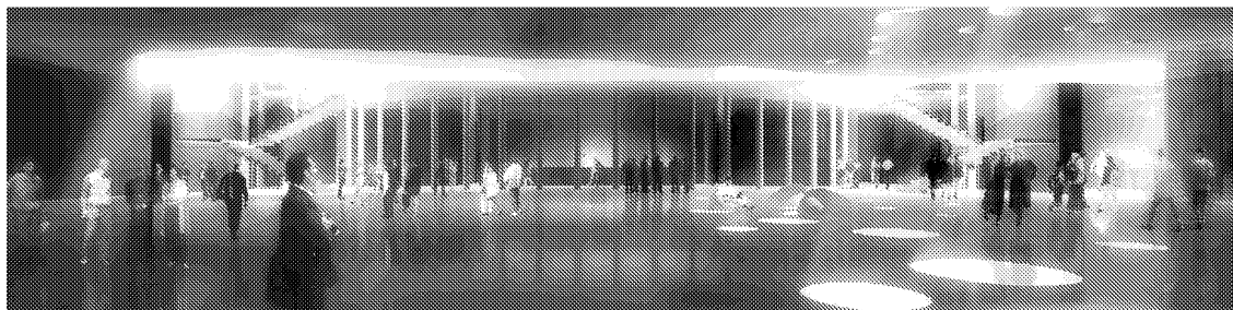
Gstaad soll ein neues Kulturzentrum erhalten. Im 100 Millionen Franken teuren Gebäude könnten kulturelle Veranstaltungen jeglicher Art stattfinden.