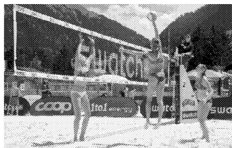
Beachvolleyball in Gstaad. Bei herrlichem Wetter wurden gestern auf den Side-Courts die Länderqualifikationen ausgetragen. 29

Was es in mehreren anderen Ländern bereits seit längerer Zeit gibt, will der Kanton Bern jetzt ein Jahr lang testen: sogenannte Rüttelstreifen, welche die Autofahrer vor gefährlichen Kurven intuitiv abbremsen lassen. In Deutschland beispielsweise haben ausführende Tests die Wirkung dieser Streifen mit Sägezahnprofil bereits erwiesen: Die Geschwindigkeit in den entscheidend markierten Kurven ging um bis zu 12 Stundenkilometer zurück. azu SEITE 10